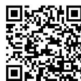
只見町 移住・定住ガイドブック