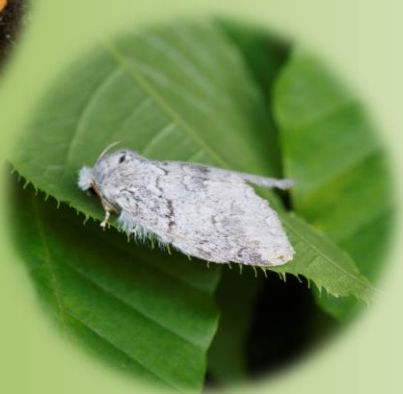
ブナアオシャチホコ