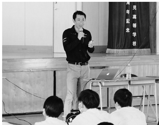
▲「今日からほんの少しずつやってみよう」と生徒へ語る室屋さん

エアレース・パイロット。2017年レッドブル・エアレース・ワールドシリーズでは、アジア人初となる年間総合優勝。福島県県民栄誉賞、ふくしまスポーツアンバサダーなど受賞。