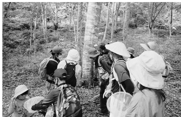
▲ブナ林に生息するセミ類の解説を聞く参加者

参加者はブナセンター職員の解説で、ブナ林内で見られた生きものや昆虫調査用のトラップにかかっていた昆虫を観察しました。夜行性のため普段あまり目にする事のないオサムシの仲間やブナを食べるカミキリムシなどが見られ、参加者は実物を観察しながらブナ林に生息する昆虫の生態について理解を深めました。