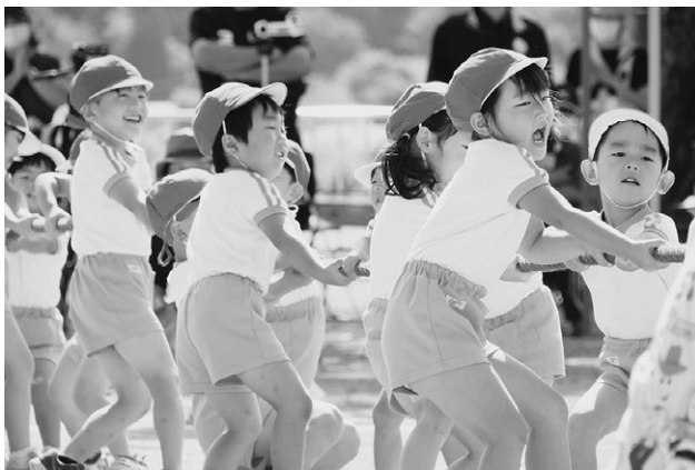
▲「つなひき」(16日/明和保育所)