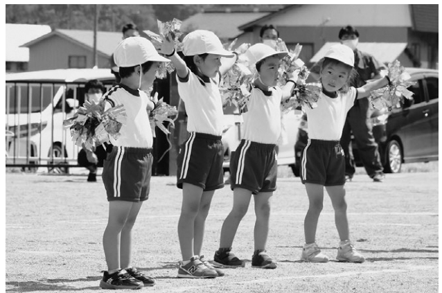
▲「あいうえおんがく」(15日/朝日保育所)