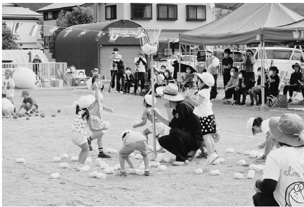
▲「紅白玉入れ」(14日/只見保育所)