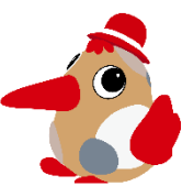
アカシヨウちゃん