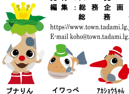
ブナリン イワッパ アカヨウちゃん

第 2 4 6 1 - 1 号 令和 6 年 1 2 月 6 日 発行：只見町課 編集：総務課 総務課 https://www.town.tadami.lg.jp/ E-mail koho@town.tadami.lg.jp