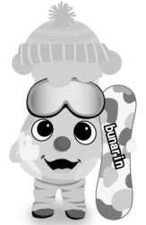
只見町公式キャラクター「フナりん」

祈願花火は、お申込みいただいた皆様の想いいっぱいのメッセージをご紹介しながら、「めでたいこと」「記念すべきこと」「追善供養」などを祈念し、雪まつりで打ち上げる花火です。お申込される方は下記申込書で郵送・持参又はFAX・メールにてお申込みください。