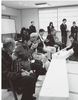
▲お茶を楽しむ来場者