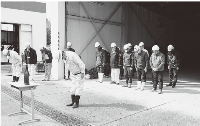
▲安全祈願をする除雪作業に携わる皆さん

除雪会議が、11月7日に開かれ、除雪路線の確認などが行われました。また、会議終了後には、今期の除雪業務の安全祈願と除雪機械の始動式が行われました。除雪機械の始動式では、除雪ドーザーとロータリー除雪車が並べられ、職員の手導で始動を行いました。除雪作業は、安全な道路確保をするための大切な作業です。ご理解、ご協力をお願いいたします。