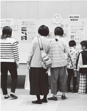
▲展示物に足を止める来場者

「第51回只見町文化祭」は、文化月間及び文化祭期間として、より多くの人に町の文化や芸術に触れてもらう機会を設ける形で実施されました。文化・芸術作品や町内各企業のSDGsの取り組みなどが10月30日から11月4日まで只見公民館で展示された他、11月3日の文化の日には、民話茶屋や茶道体験などが実施され、来場者は只見町の文化・芸術に触れました。