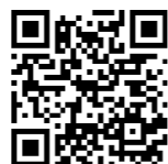
祈願花火申込フォーム

■申込方法 令和6年12月6日発行のおしらせばんをご覧ください。または、右記QRコードの祈願花火 申込フォームから申し込むことも可能です。