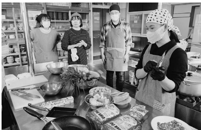
▲作り方を説明するレさん