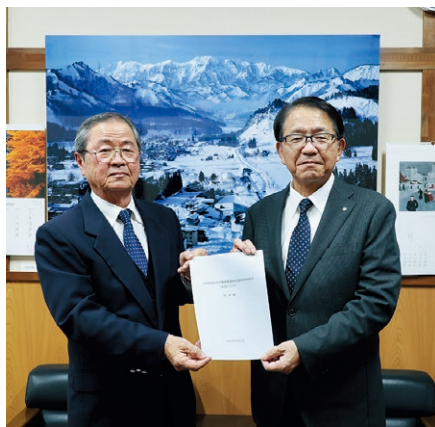
▲審議会長を務めた小沼会長(左)

料金改定案では、水道基本料金は月額500円増、超過料金は1㎡あたり50円増、農集排基本料金は月額300円増、超過料金は1㎡あたり30円増が示されました。