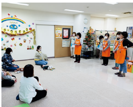
▲かるがもクラブで活動する民生児童委員の皆さん

子育てや介護、教育、お金に関してなど些細なことでも構いません。ぜひお近くの民生児童委員までご相談ください。（※秘密は厳守されます）