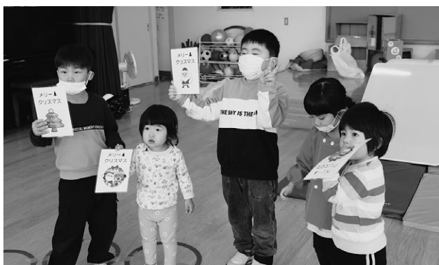
▲こども園のさくら組、たんぽぽ組が只見保育所クリスマス交流会に参加しました

12月クリスマスシーズンに合わせて、ぶなのもりこども園や只見保育所、かるがもクラブなどでクリスマスを楽しむイベントが行われました。また、明和青年団は、明和地区内のプレゼント配布を希望した子どもたちの自宅を回り、プレゼントを配りました。