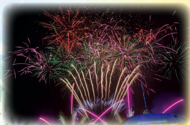
▲只見町の夜空に打ちあがる祈願花火