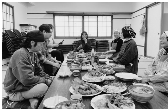
▲皆で美味しくいただきました