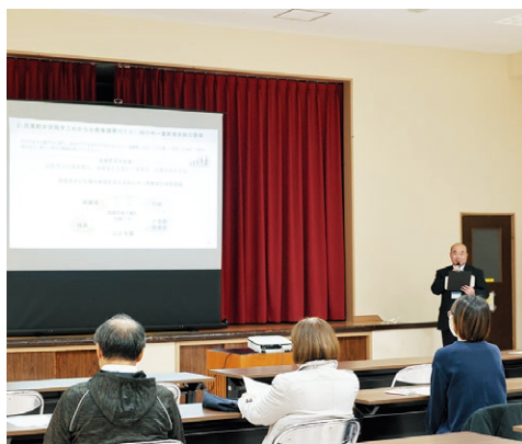
▲保護者、住民、教育機関、行政が一体となって、子どもたちが健やかに育つ環境づくりを目指します

また、統合の時期について、校舎建設や教育環境整備に必要な期間を考慮し3～4年後を目指すことや、併せて認定こども園の園舎等整備について、朝日小学校校庭を予定地としていることなどを説明しました。