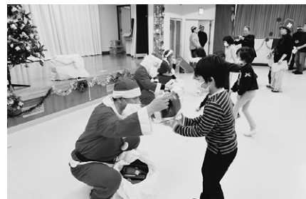
▲朝日クリスマス会はビンゴ大会や、プレゼント交換会の他、サンタさんがクリスマスプレゼントを届けてくれました