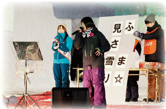
▲前夜祭ステージで行われたカラオケ大会