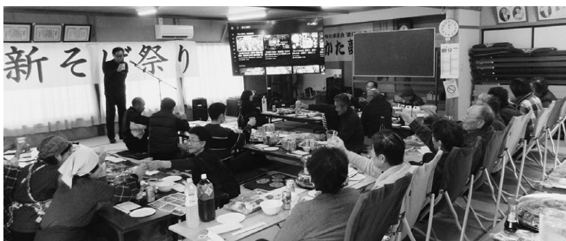
▲盛大に行われたそば祭り

今回の取組みについてそば組合は、「天候や倒伏に悩まされたが、予想以上の収穫となった。引き続き作付けを行い、集落の活性化を目指したい」とのことです。