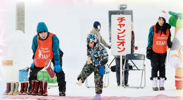
▲毎年、多くの方が参加される長靴飛ばし