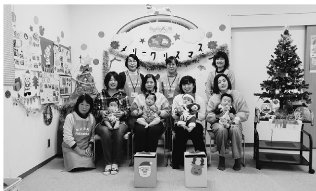
▲かるがもクラブクリスマス会は4組の親子がクリスマスイベントを楽しみました