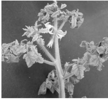
▲ トマト黄化葉巻病の症状

近から黄化し、葉が巻き込みます。病気が進行すると葉が小型化し、一見ジャガイモの葉のようになり、開花しても実が付かなくなりまます。