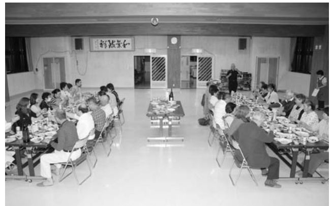
▲ 朝日地区センター運営委員会が主催