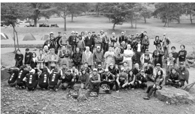
▲ 秋空のした交流の輪を広げたバイク仲間