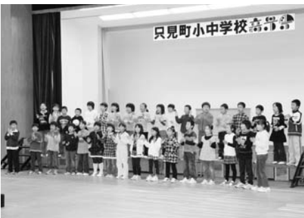
▲只見小学生の元気な合唱

11月11日に只見中学校体育館で行われた「只見町小中学校音楽祭」には、只見小3・4年生、明和小3・4年生、朝日小4・5・6年生と只見中全校生徒が参加、小学校は合唱と合奏を披露し、中学校は全校生徒と特設合唱部の合唱を披露しました。元気に楽しく歌う小学生、迫力ある演奏で楽器を奏でる合奏、そして爽やかで清らかな歌声が響き渡った中学生の合唱、いずれも完成度の高い合唱と合奏の連続に、来場された保護者からは感動と同時に大きな拍手が送られています。練習の成果がすべて発揮されたすばらしい音楽祭でした。