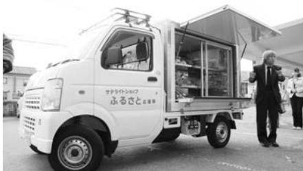
▲奥会津フレッシュ便