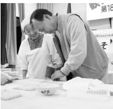
▲ そば打ちを体験する参加者

また、お土産にそば焼きもちとふきのとうの田舎煮も準備され、参加者は最後まで只見の秋の味覚を楽しむことができ満足な様子でした。