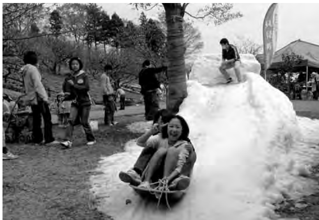
▲雪のすべり台を楽しむ柏市の子どもたち