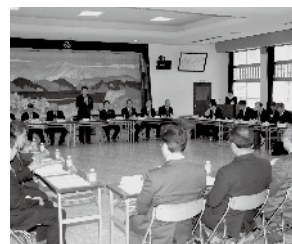
▲あいさつをする目黒町長

本年度の重点事項や協力事項についての説明が行われ、質疑応答で、地元産木材の利活用の推進、農業集落排水使用料の見直し、集落内舗装道路の修繕、只見中学校道路改良に伴う予算の状況、道路舗装工事にかかる請願の処理状況、融雪災害の状況報告にかかる対応、廃屋の撤去対策などについて、活発な意見交換がなされ、副町長や担当課長などが