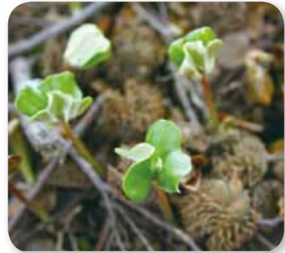
上の写真は浅草岳・山神杉あたりのブナ林。 下の写真は種子から発芽したばかりのブナの实生