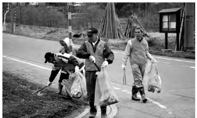
▲ポイ捨てがなくなることを願いごみを拾う参加者

朝日地区センター運営委員会などが主催し、4月29日に行われた、ちょボラごみ拾いには約100名が参加、亀岡地区から榎戸地区までの国道や県道沿いのごみを拾う清掃作業を行いました。曇り空の肌寒い天候のなか参加者は空き缶や空き箱、ペットボトルなどのごみを分別しながら拾いました。集められたごみの量は軽トラック2台分で、中にはガステーブルや古タイヤなどもありました。