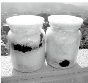
▲菌糸瓶で育つ只見産オオクワガタの幼虫