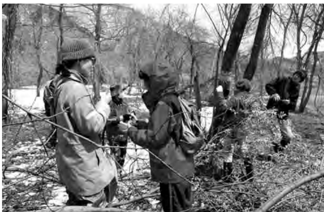
▲ユビソヤナギ一本一本を詳しく調べる参加者

只見の自然に学ぶ会では、4月18日に亀岡橋周辺の伊南川に生息するユビソヤナギ約170本を調査しました。参加者は8名、残雪の上を歩きながら幹の太さや雌花、雄花の別などを確認しました。同じ調査は3年前にも行われており、今回は前に調査した木の再調査。ほとんどの木が前回の調査記録より約10センチメートルほど幹が太くなっていたことに参加者は驚いていました。