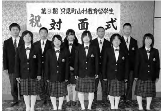
▲奥会津学習センターで生活をともにする10名