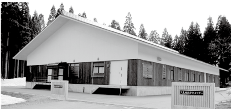
▲平成19年7月に供用開始した只見地区浄化センター

今後は、原則として水道使用量に比例して農業集落排水使用料が決定されますので、節水などにご協力いただきますとともに、ご理解をお願いいたします。