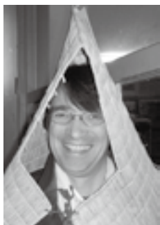
▲カンゼンブーシをかぶった筆者