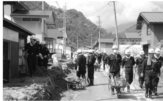
▲消防団ボランティア(八木沢地区)

また、南会津町・下郷町・松枝岐村・昭和村・那須町の消防団員の方も、がれき除去等のボランティア作業で延べ250人のご協力をいただきました。ありがとうございます。