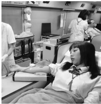
▲献血に協力する只見高校生