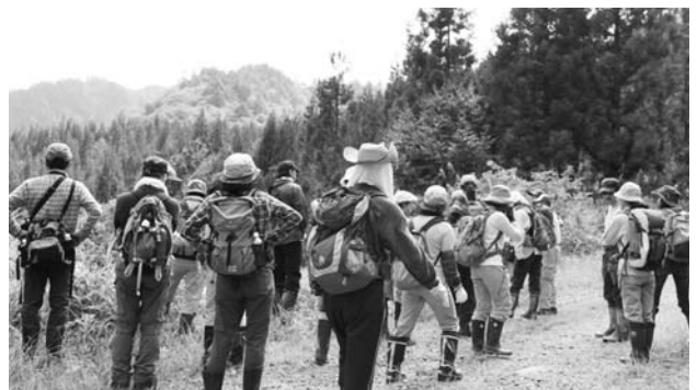
▲布沢の林道を出発する参加者