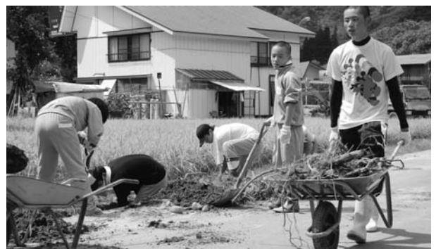
▲側溝の土砂を撤去する只見高校生