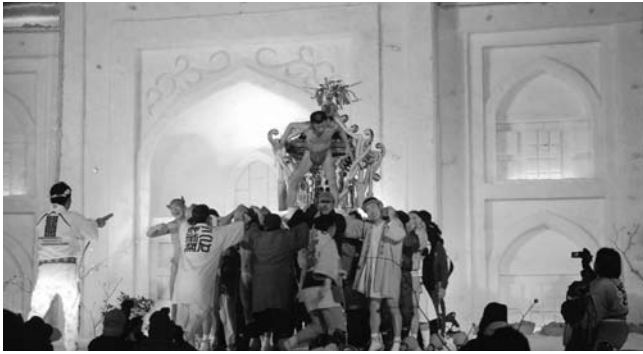
▲雪まつりの代表イベント「雪中大神輿」