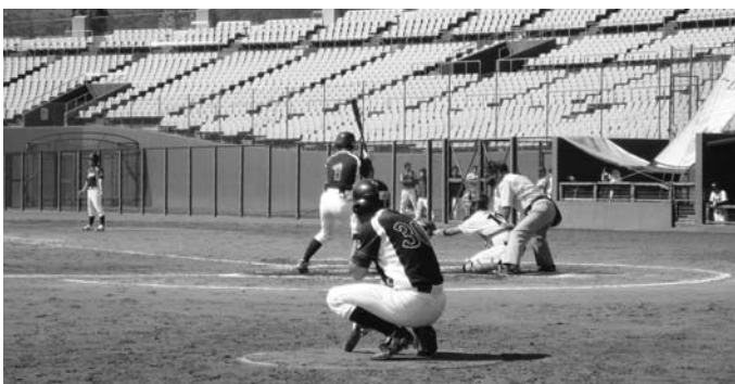
▲町民に元気を与えた只見町チーム

来年こそは初戦突破を目指すことを誓い合いました。今後の只見町チームの活躍に期待したいと思えます。