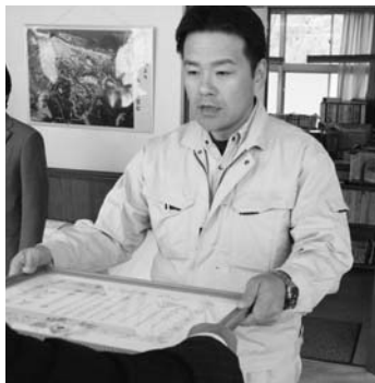
▲感謝状を受ける団体代表者