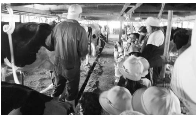
▲角田ミルクプラントでの見学会

9月30日、只見・朝日・明和保育所の年長児で南会津町の（有）角田ミルクプラントを見学し、乳牛がしぼられる様子を見学したり、子牛やヤギと触れ合いました。その後、そのミルクを使ってみんなでホットケーキを作って食べながら、牛から分けてもらった命の贈り物について感じ合いながら、食べ物の大切さを実感しました。