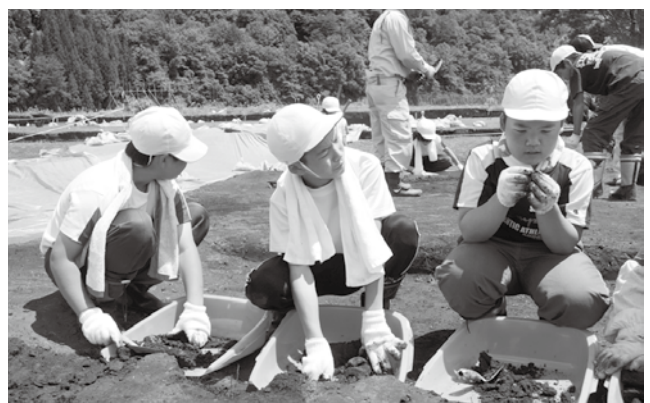
▲只見の歴史と文化を体験で学んだ児童

只見町教育委員会が調査を行なっている「黒谷館跡」発掘調査現場（朝日地区センターわき）を朝日小学校の6年生11名が6月11日に訪れ、発掘調査に挑戦しました。総合学習の社会科体験見学により行われた授業で、児童は説明を受けたあと、移植シャベルなどで丁寧に土を削り遺物を探す作業を手伝いました。約2時間の作業で見つけた土器の破片は10個以上、終了間際には大きな破片も掘り当て、只見の歴史に直接触れた児童は心から感動した様子でした。