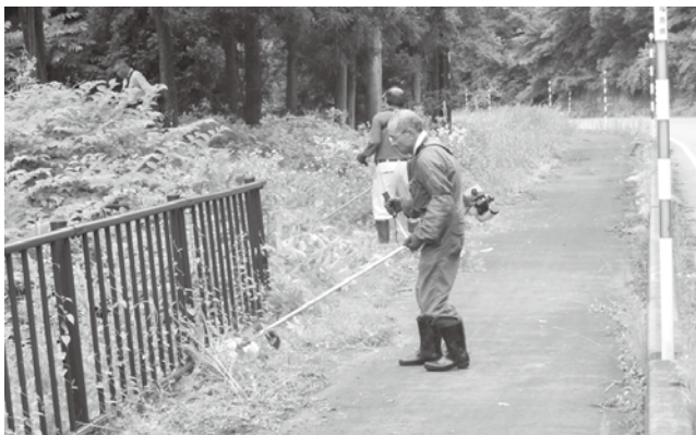
▲美しいまちづくりに貢献される参加者

明和地区センター運営委員会のまちづくり部会メンバー8名が6月20日の夕方、只見町と南会津町の境界付近の国道と県道沿いをきれいにしようと、草刈りやゴミ拾いなどの清掃作業を行いました。参加者は、梁取地区の国道と二軒在家地区の県道沿いや駐車スペースなどの周辺を草刈り機できれいにしたあと、捨てられた空き缶やゴミを拾い集めました。作業を行なった方々は、ゴミのポイ捨ては絶対にしないでほしいと、願いを口にしていました。