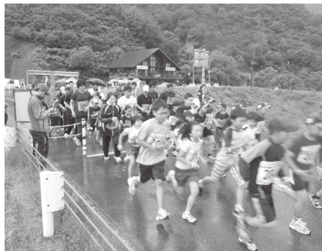
▲勢いよくスタートするマラソン部門の参加者

町体育協会の主催で、6月17日に只見湖岸健康マラソン&ウォーキング大会が只見ダムと町下地区周辺を会場に行われました。マラソン部門とウォーキング部門合わせて159名が参加、皆さん思い思いのペースで走ったり歩いたりして、楽しく汗を流し全員が完走、完歩しました。各部門の優勝者は次の方々です。おめでとうございます。