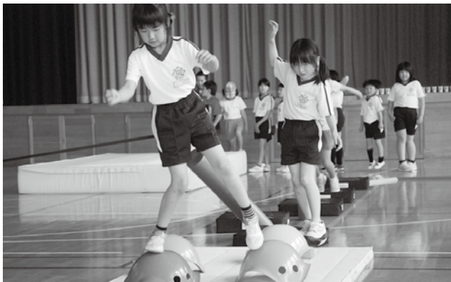
▲遊び感覚で楽しみながら運動する児童

教育委員会では、子どもたちの基礎体力の向上や生活・学習習慣を身につけることなどを目的に「子育てひろば事業」を新たに行なっています。参加している児童は明和小学校の1年から5年生の希望者25名で、6月6日に明和地区センターで行われた開始式をスタートに毎週水曜と金曜の放課後、同校体育館などを会場に、ただみコミュニティークラブの方が指導者となり、みんなで楽しく汗を流しています。今年度は来年2月まで活動していく予定です。