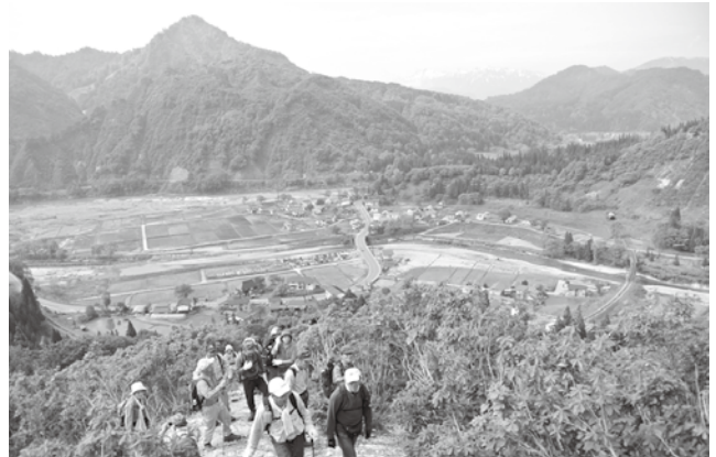
▲緑に染まる山々をバックに山頂を目指す登山者

蒲生集落活性化委員会が主催する「蒲生岳山開き」が6月3日に開かれ、町内外から220人が標高828メートルの山頂を目指しました。蒲生集会所で安全祈願の神事が行われ、記念バッジと特製ポストカードを受け取った参加者は笑顔で登山を開始しました。この日は天候も良好で、登山道わきに咲いたヒメサユリやツツジなどが登山客を和ませ、山頂では残雪の山々が360度見渡せる絶景に登山者は、疲れを忘れカメラのシャッターを切っていました。