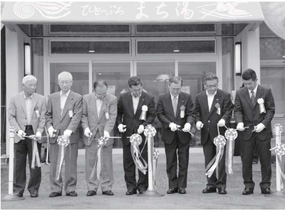
▲関係者によるテープカットのようす

新保養センターは、今まで以上に町民に愛着をもつていただけるよう「ひとつぷろ まち湯」という愛称がつけられ、浴室にはサウナや打たせ湯が新