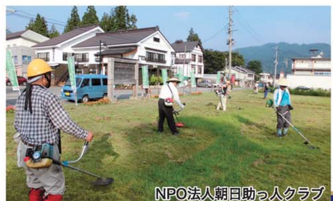
NPO法人朝日助っ人クラブ