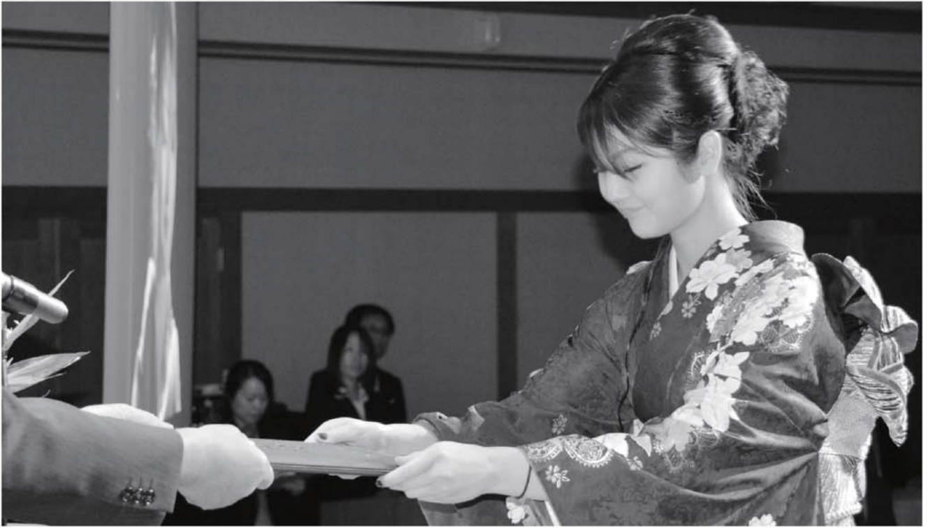
▲成人証書を受けとる新成人