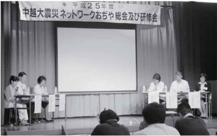
▲パネルディスカッションのようす

平成25年度「中越大震災ネットワークおぢや」の総会及び研修会が8月1、2日にかけて季の郷 湯ら里で行われました。このネットワークは、小千谷市が事務局となり、中越大震災後の平成17年に設立され全国71自治体が加入しています。2日の研修会は公開プログラムとしてテーマを『元気』が支える地域の再建』とし、パネルディスカッションが行われました。パネリストは東日本大震災で被災された気仙沼市の(有)オйкаワデニム代表