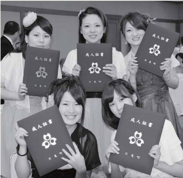
▲成人証書を手に記念にパチリ!