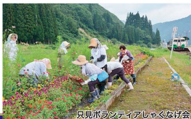
只見ボランティアしゃくなげ会