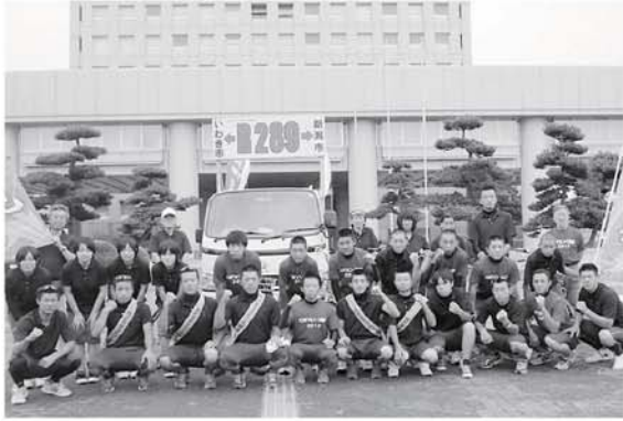
▲ゴールの新潟県庁前で

2日目は只見町役場を出発し叶津へ。八十里越区間を越え三条市役所からは目黒町長、国定三条市長とともにゴールの新潟県庁を目指しました。 生徒たちは無事にゴールし、この真夏のイベントを大成功させました。