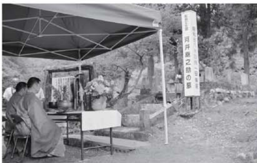
▲小千谷市の慈眼寺住職による読経