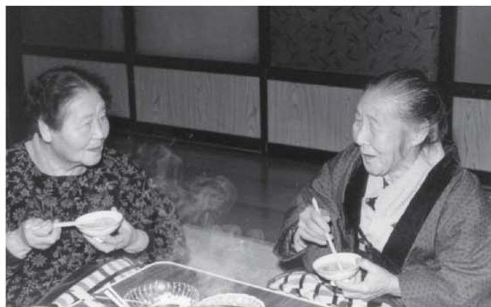
▲お母さんやおばあさんが集まって楽しむ飴よばれ(坂田)

ところで、江戸時代の若松城下では、有名な飴屋さんが二軒あり、お祭りの時などは行列ができるほどにぎわいました。それもそのはず、会津藩士の子どもたちは日常はお金を持つての買い食いはできませんでしたが、お祭りの時だけは飴を買うことができました。飴を箸に絡ませて食べ歩くことが許されていたのです。また、『東海道