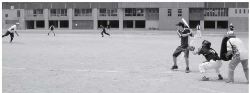
▼ 真夏の熱戦が繰り広げられた一日となりました

幅広い年齢層の方が参加した大会となり、夏の暑さにも負けず元気あふれるプレーで会場は盛り上がりました。