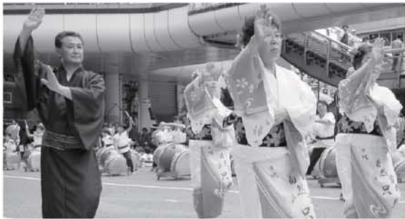
▲目黒町長も踊りました

初日は早朝にいわき市を出発し、暑い夏の日差しの中、甲子道路や駒止峠などアップダウンの激しい峠道を自転車で走り只見町に到着しました。