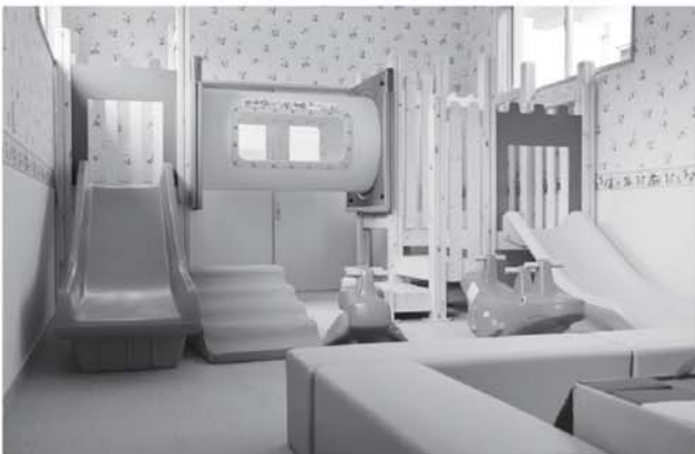
▲新設されたキッズスペース

設されました。また、キッズスペースとしてすべり台などの遊具が置かれた部屋や個室も新設されるなど様々な年代の方が利用できる施設となりました。 食事メニューも豊富で価格もリーズナブルですので、ご家族やご友人など多くの方々に「ひとつぷろ まち湯」をご利用頂き、この施設を町民の方々の憩いの場として欲しいと思います。