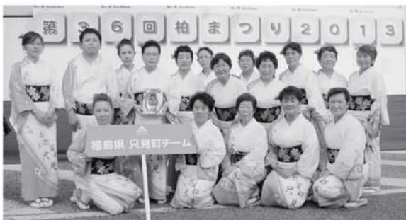
▲受賞記念に参加者で記念撮影

7月27日に千葉県柏市のJR柏駅前で行われた柏おどりコンテストに町内踊りの各団体から15名、ここに町関係者3名が加わり計18名で参加しました。町のキャッチフレーズである「自然首都・只見」というロゴが入った白と緑色を基調とした浴衣に身を包み、凛とした表情で美しい踊りを披露しました。練習の成果を十分に発揮した結果『千葉テレビ放送賞』を受賞。『千葉テレビ放送賞』は過去最高の結果となりました。