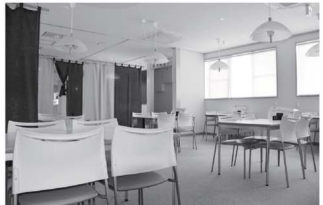
▲清潔感のある食堂