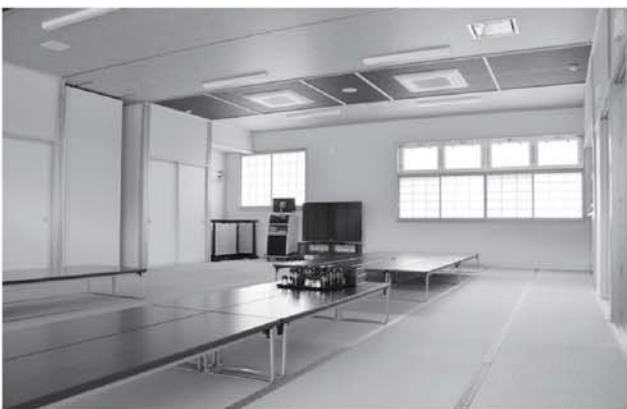
▲ゆっくりくつろげる大広間