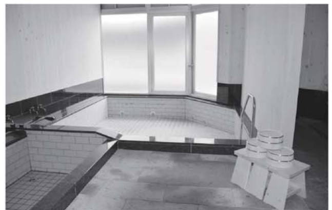
▲綺麗になった浴室