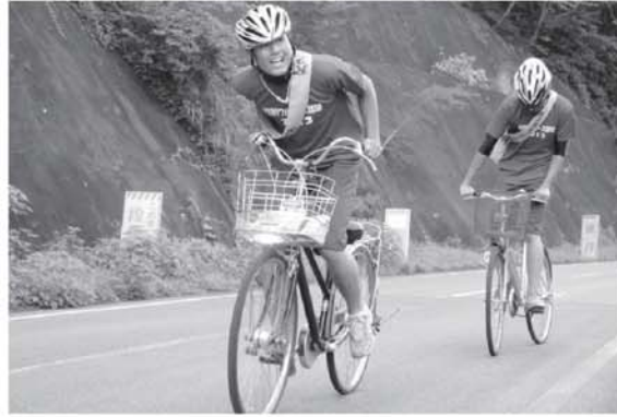
▲つらい登り坂も頑張りました

2日目は只見町役場を出発し叶津へ。八十里越区間を越え三条市役所からは目黒町長、国定三条市長とともにゴールの新潟県庁を目指しました。 生徒たちは無事にゴールし、この真夏のイベントを大成功させました。