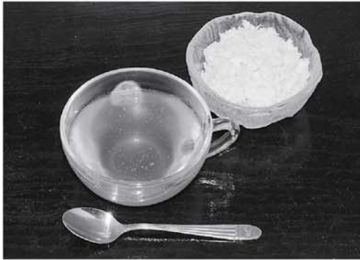
▲ 飴(手前)と絞りかす(右奥)

これまで継承されてきた飴よばれという伝統的な行事が、只見の誇れる無形文化財として孫子にわたって続けていってほしいと願っています。