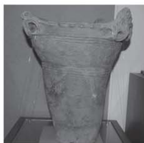
▲写真1:小川上野遺跡から出土した縄文時代中期の土器

只見町で人が営みを始めたのは、旧石器時代からと考えられています。旧石器時代の石器が、塩沢わらび園付近の猿倉遺跡や蒲生岳の山ろくにある蒲生A遺跡から発見されているからです。また、土器が一般的に使われ始めたのは縄文時代です。縄文時代は、およそ一万三千年前から二千五百年前まで続き、草創期、早期、前期、中期、後期、晩期に区分されています。では、只見町で確認されている土器は、いったいどの時代のものなのでしょう。 土器は、標識遺跡 ひょうしき という時代の区分に重要な役割を果たした遺跡を基準として、その時代の遺構（柱穴など）や遺物（土器など）と照らし合わせて、およその年代を決めます。只見町の土器の年代を決定するには、他県や他市町村から発見された