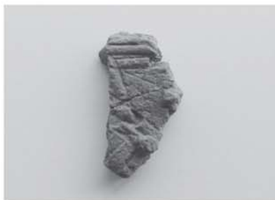
▲写真2:七十苧遺跡から出土した縄文時代前期の土器（諸磯C式土器）

これまで只見町でもっとも古い土器は、縄文時代中期（四千年〜五千年前）とされてきました。この時期の土器が確認されているのは、大倉の窪田遺跡、館ノ川遺跡、小川上野遺跡（写真1）、深沢遺跡、小林外出遺跡などです。窪田遺跡は、縄文時代晩期から弥生時代中期の土器が中心ですが、縄文時代中期の大木9式（宮城県七ヶ浜町大木貝塚）という形式の土器があり、これが一番古い土器でした。館ノ川遺跡、小川上野遺跡、深沢遺跡、小林外出遺跡でも、縄文時代中期の大木8式という形式の土器が確認されています。