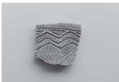
▲写真3:七十苧遺跡から出土した縄文時代前期の土器（大木5式期土器）

しかし、只見町には縄文時代中期よりも古い土器はないのでしょうか。実は数は少ないですが、最古の土器が小林の七十苧遺跡で発見されました（写真2、3）。これは平成二十〜二十三年にかけて行われた伊南川の河川改修工事による発掘調査でわかったものです。写真2は、諸磯C式（神奈川県三浦市諸磯貝塚）と同じ形式と考えられる土器です。小さな破片ですが、たくさんの線で区画され、コブ状にペタペタ貼り付けた文様をしているのが特徴です。写真3は、線で区画して、連続した山形の文様をしている土器です。同様の形式は不明ですが、大木5式期と考えられます。