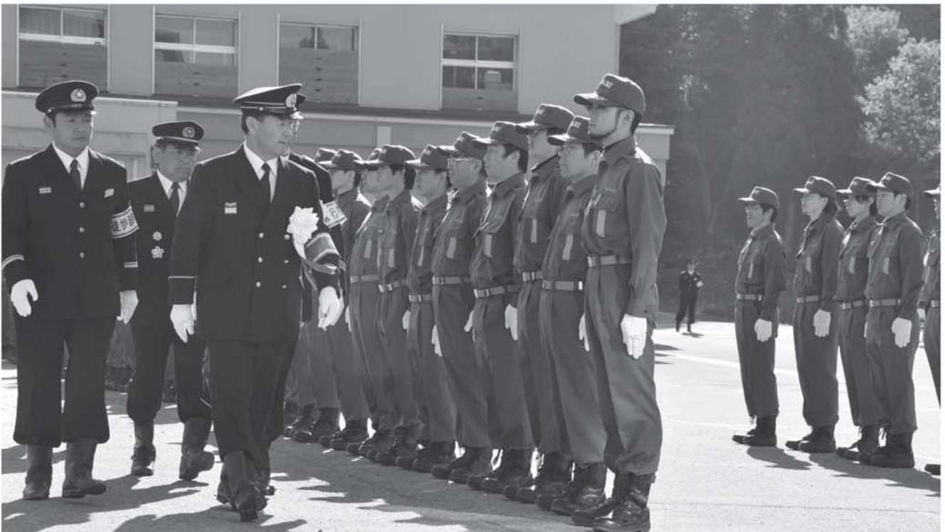
▲目黒町長から通常点検を受ける団員