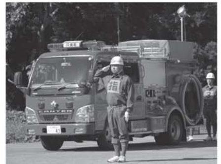
▲県大会に出場したポンプ操法も披露