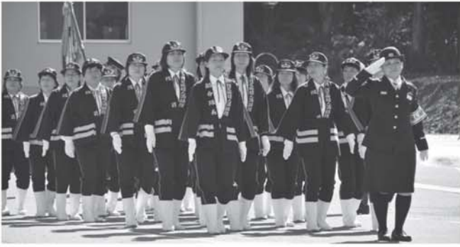
▲分列行進をする婦人消防隊