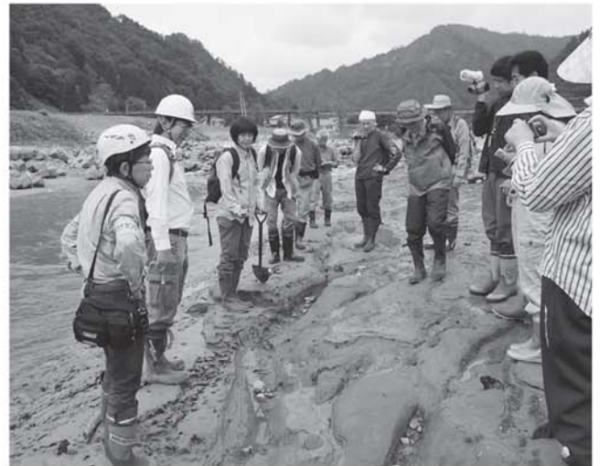
▲河原での堆積した地質の観察