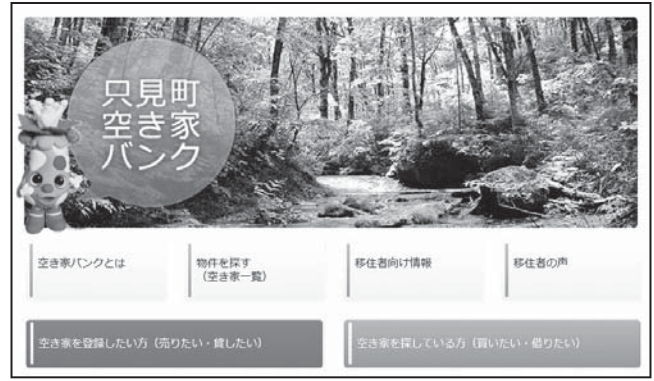
▲町HPで掲載している空き家バンク