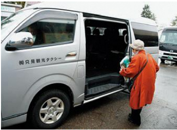
▲第1便に乗車する利用者