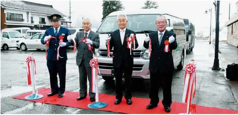
▲テープカットで祝った出席者の皆さん