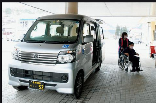
▲車椅子のまま乗降できる福祉乗合いいきいきバス

この「福祉乗合いいきいきバス」は、通院や買い物などに利用されることが多く、車椅子を利用される方の移動手段として支えています。これからも、町民の皆さまのお役に立てるよう「安全は最大のサービス」をモットーに運行いたします。どうぞ、お気軽にお問合せのうえ、ご利用ください。