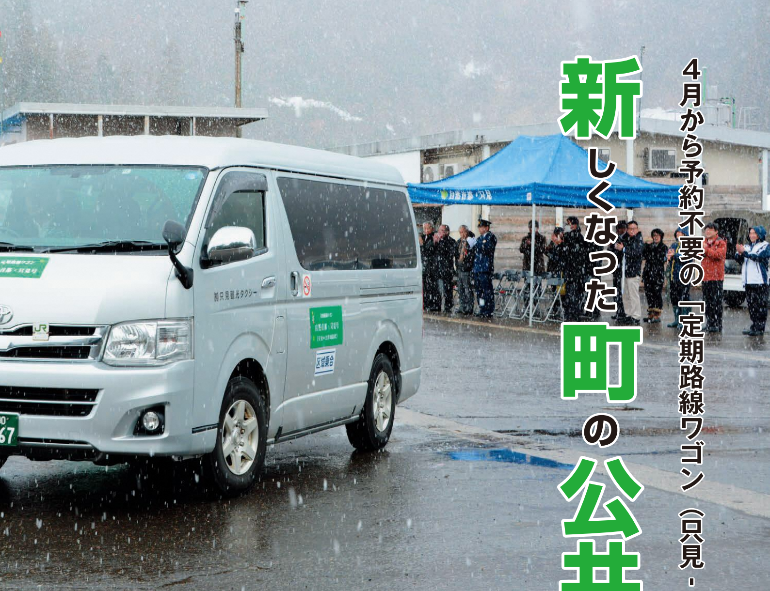
▲多くの地域住民が見守る中、第1便が只見駅を出発した定期路線ワゴン「自然首都・只見号」

町では、これまで町内で運行している公共交通の一部を見直し、4月1日から新たに「定期路線ワゴン 自然首都・只見号」の運行を開始し、デマンド交通「只見雪んこタクシー」と「福祉乗合いいきいきバス」の利用料金改定を実施しました。 本号では、「定期路線ワゴン」の内容と「只見雪んこタクシー」「福祉乗合いいきいきバス」についてご紹介します。