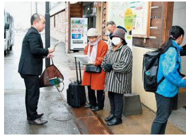
▲駅前のバス停で待つ利用者