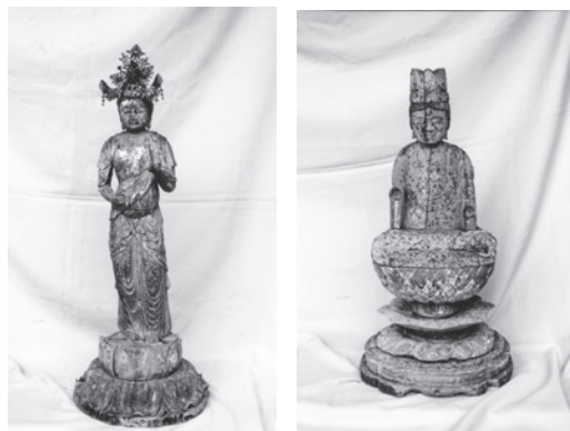
▲右:木造虚空蔵菩薩坐像(室町時代) 左:木造虚空蔵菩薩立像(江戸時代初期)

今後は、文化財として適切な保存を行い、只見町の歴史を読み解く資料として活用を進めます。