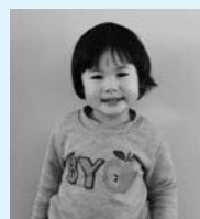
一条 とあさん(二軒在家)