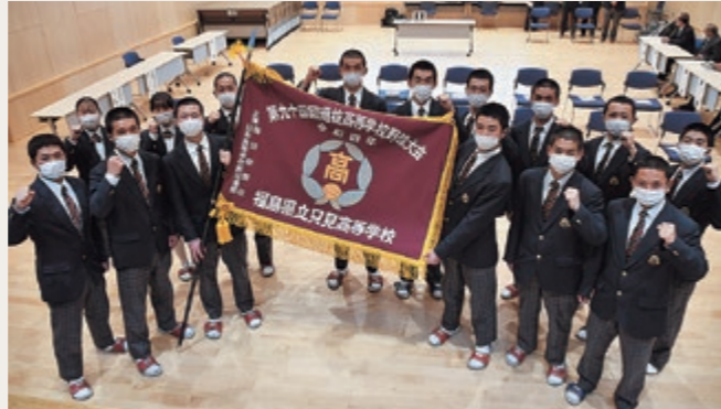
出場旗を掲げる只見高校野球部

只見高校野球部は、マネジャーを含む部員はわずか20名ですが、豪雪地帯での厳しい環境の中にあって、練習方法を工夫するなど困難を克服してきました。2021年の県大会ではベスト8に進出し、2022年3月に開催された第94回選抜高校野球大会に21世紀枠で出場しました。夢の大舞台で健闘した只見高校生たちと一緒に、新しい道を切り拓いていきませんか。