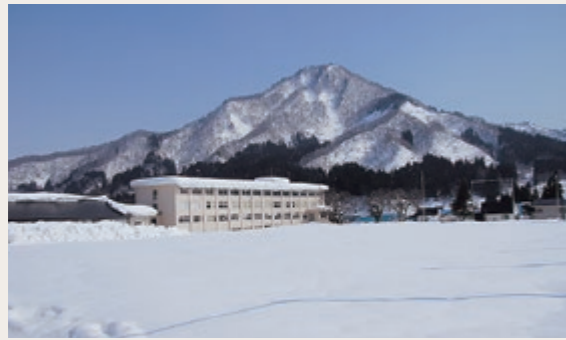
冬の只見高校全景

只見高校は、福島県会津地方の高等教育の場として、地域とともに70年の歴史を歩んできました。全日制普通科、各学年1クラスずつの構成で、全校生徒90名が学んでいます。小規模校ではありますが、それを利点ととらえ「小さな学校の大きな可能性」を共通の考え方として掲げ、教育活動に取り組んでいます。