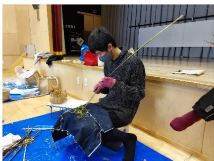
足に木を立ててナイフで削ります