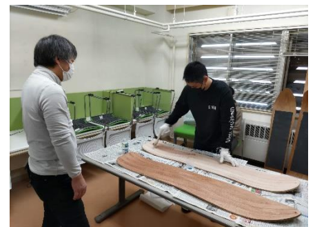
ニス塗はムラなく