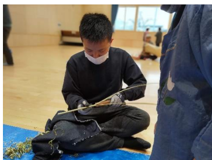
専用の道具で割いています