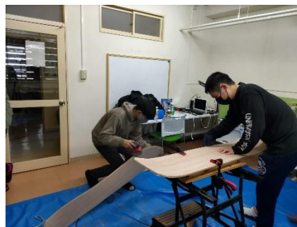
やすりで切り口を滑らかに