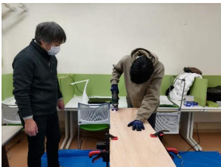
シグソーは板に押しあてて